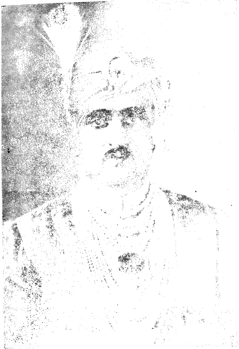
जम्मू-काश्मीर राज्य के यशस्वी एव गो-योन्ना लै० जनरल हिज हाईनेस राजराजेश्वर महाराजाधिराज श्रद्धास्पद श्री हरिसिंह जी K. C. S. D., K. C. I. E., K. C. V. O., LL. D. को, जिन्होंने हिन्दुस्तान के राजाओं, महा-