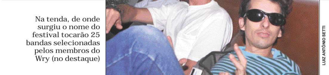
Na tenda, de onde surgiu o nome do festival tocarão 25 bandas selecionadas pelos membros do Wry (no destaque)

grante do Wry, a verba para o evento foi de R$ 50 mil, sendo que deste valor, R$ 37 mil foi recebido da Linc e os restantes por patrocinadores.